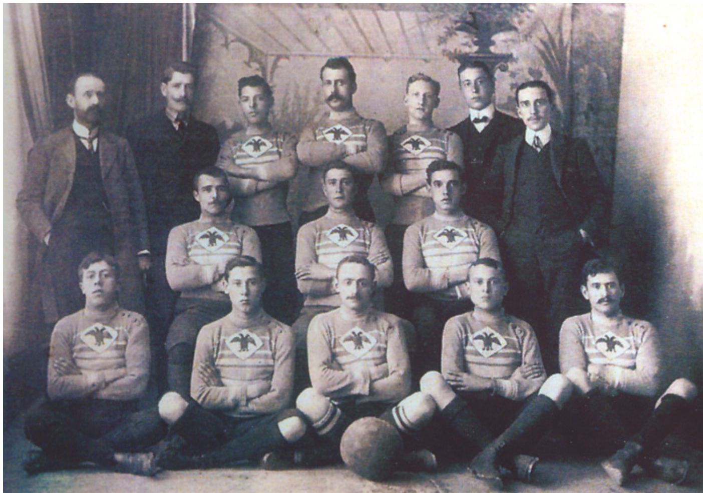
Formación del Águilas Football Club (muy probablemente de 1904)