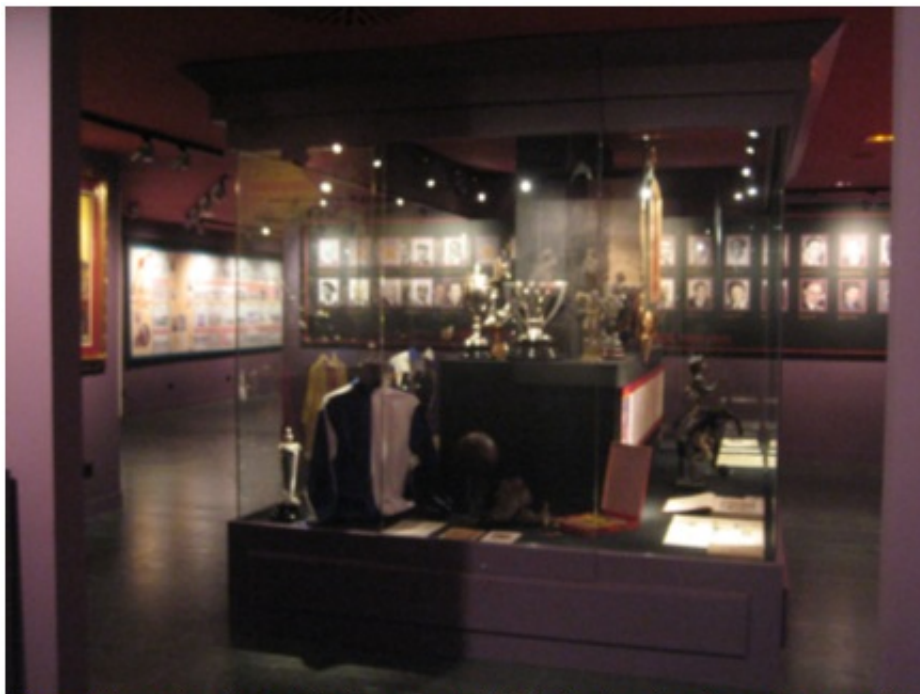
Vista de la sala principal del museo de la RFEF, donde se haya la carta. Madrid.