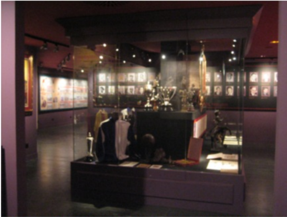
Vista de la sala principal del museo de la RFEF, donde se haya la carta. Madrid.