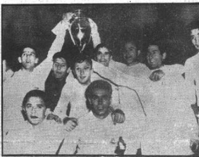
PENTACAMPEONES. —Ya no es el Madrid el cuadruple campeón. Después de su hazaña de ayer en Hampden Park, los merengues han conseguido lo irrealizable: su quinto título europeo, que esta vez puede ser celebrado con el título mundial. Los merengues, después de su éxito, posan en grupo, la Copa en alto.

130.000 espectadores aclamaron al vencedor