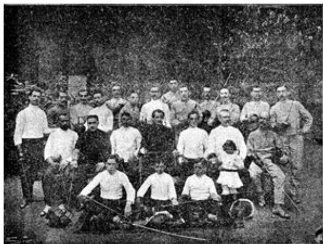
Los profesores y un grupo de alumnos del Gimnasio Solé

El Gimnasio Solé de Barcelona fue mucho más que un gimnasio, fue el lugar donde nacieron los más destacados clubs y entidades polideportivas, así como medios de comunicación y multitud de iniciativas en el ámbito del regeneracionismo en (o desde) la educación física, el deporte y el higienismo.