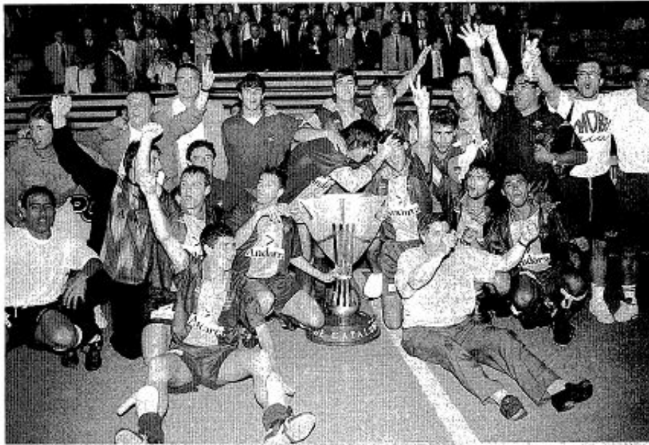
Euforia • Los jugadores del Andorra, jubilosos, celebran el triunfo conseguido sobre el Español en la Copa de Catalunya • FOTO: OUSQUE GARDIÀ

El Español no puede marcar y la Copa de Catalunya se decide en los penaltis (2-4)