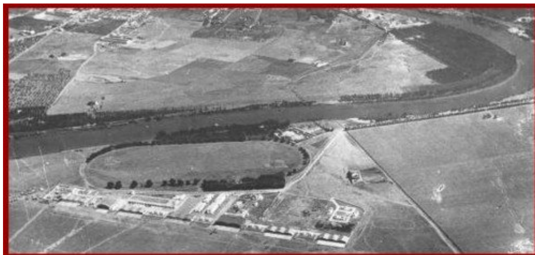
Hipódromo de la "Sociedad de Carreras de Caballos" (Sevilla) Imagen de 1929