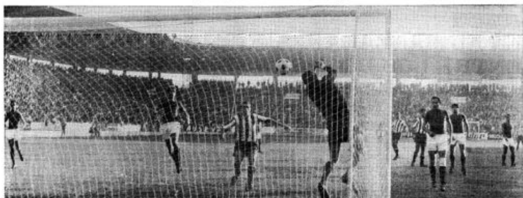
Segundo tanto del Sporting. En la imagen se ve cómo el balón es pateado por Chorrero, y Quiñones se lanza al gol.

Antes