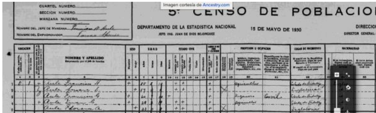
Censo de Población estado de Hidalgo 1930