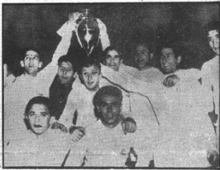
PENTACAMPEONES. —Ya no es el Madrid el cuadruple campeón. Después de su hazaña de ayer en Hampden Park, los merengues han conseguido lo irrealizable: su quinto título europeo, que esta vez puede ser rivalizado con el título mundial. Los merucos, después de su éxito, posan en grupo, la Copa en alto.

130.000 espectadores aclamaron al vencedor