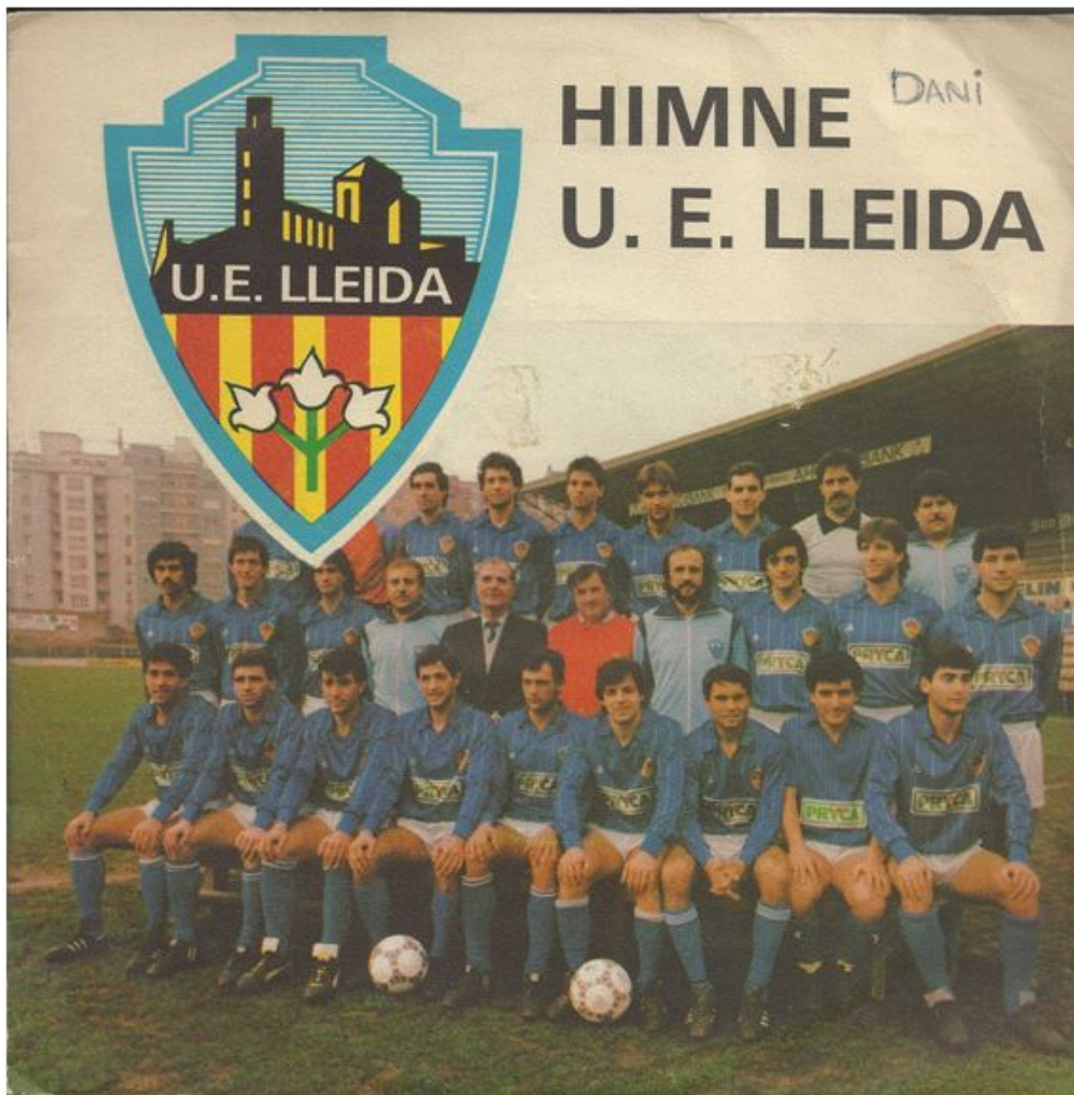
Portada del disco grabado en 1986.