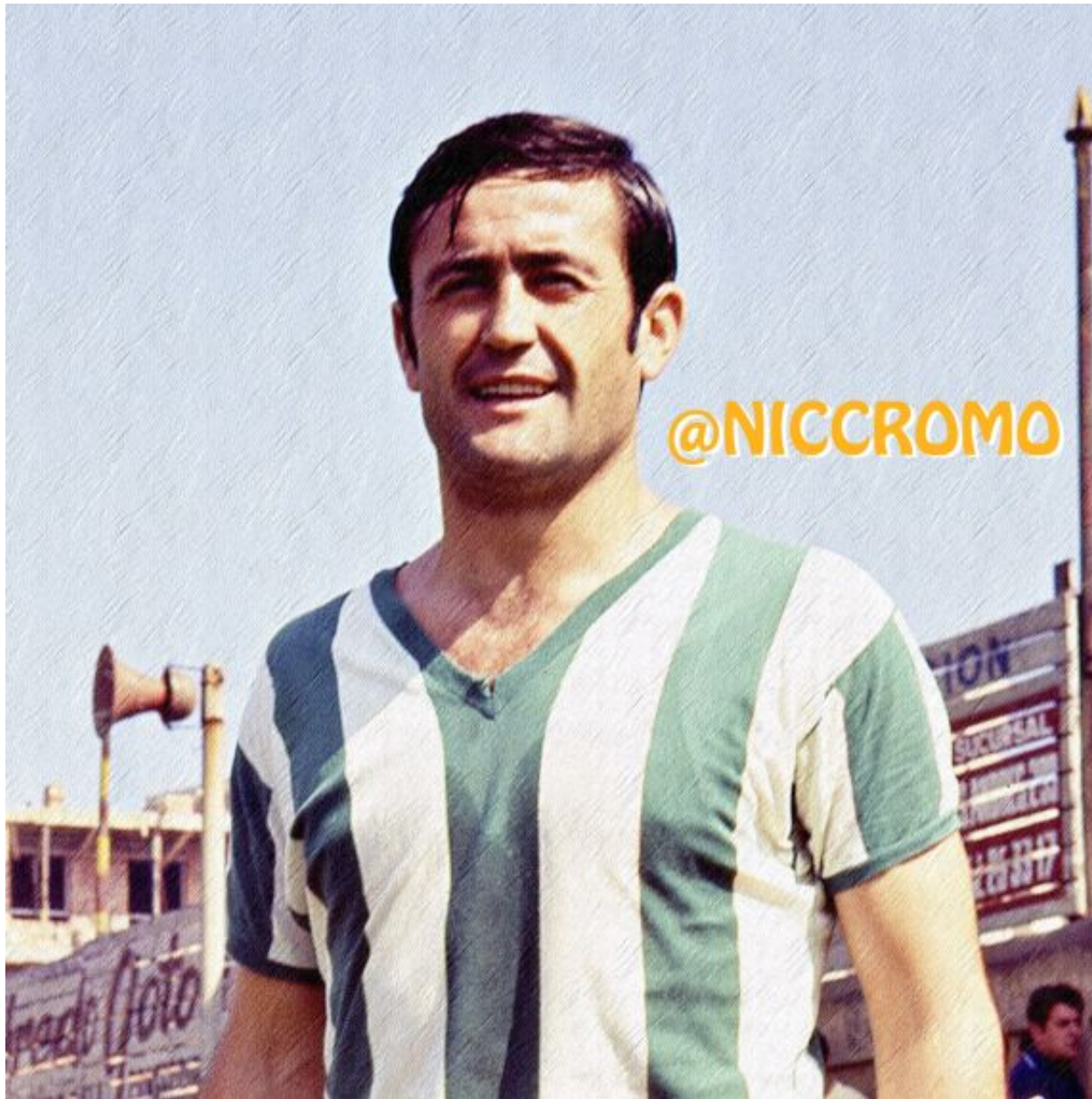
Córdoba. Temporada 1968/69

En la temporada 1968/69 vuelve a nuestra liga vistiendo la camiseta del Córdoba disputa un total de diecinueve partidos descendiendo con el equipo a la categoría de plata. Juega una temporada más en el equipo cordobés disputando un total de treinta y tres partidos y anotando un gol.