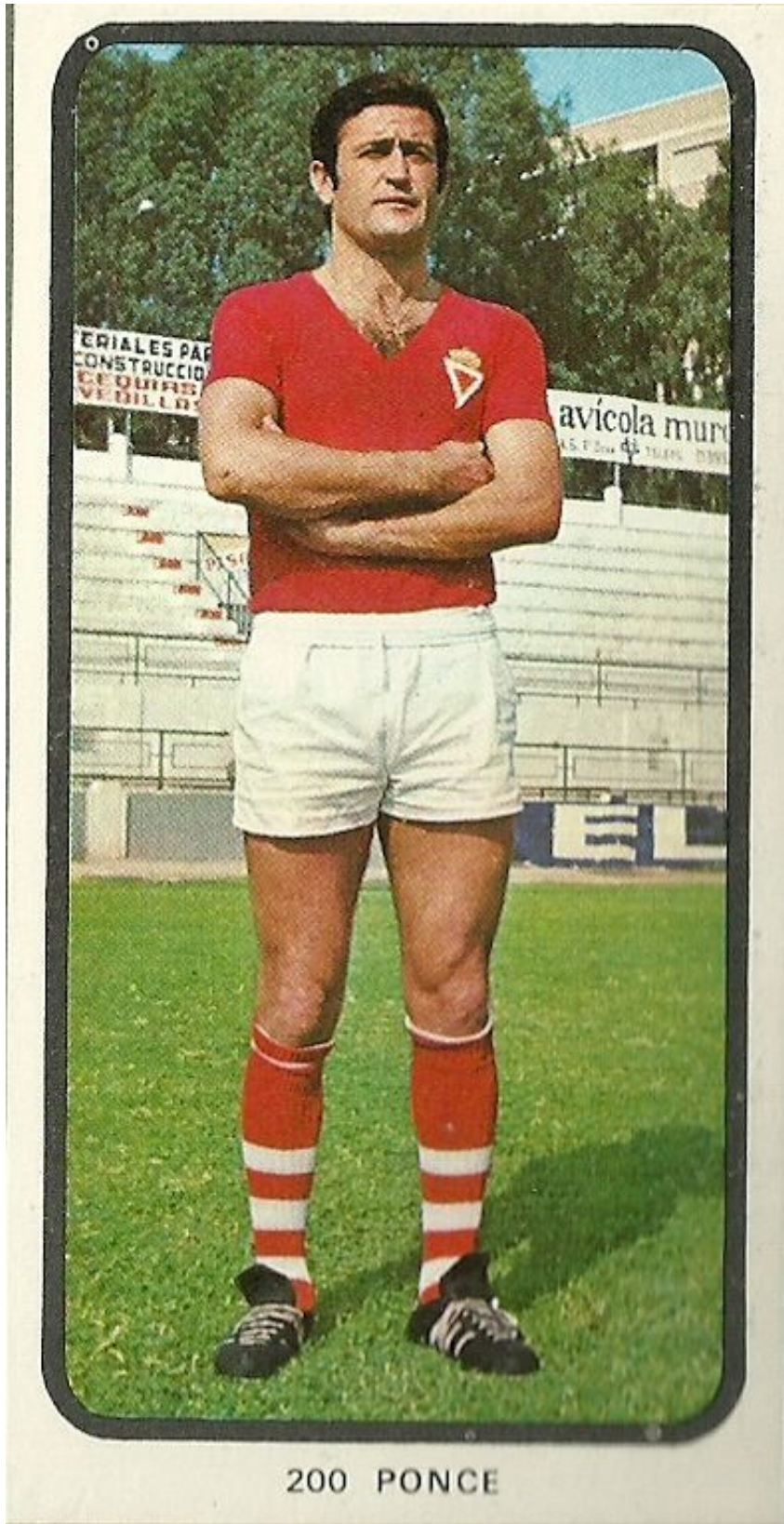
Murcia. Temporada 1973/74