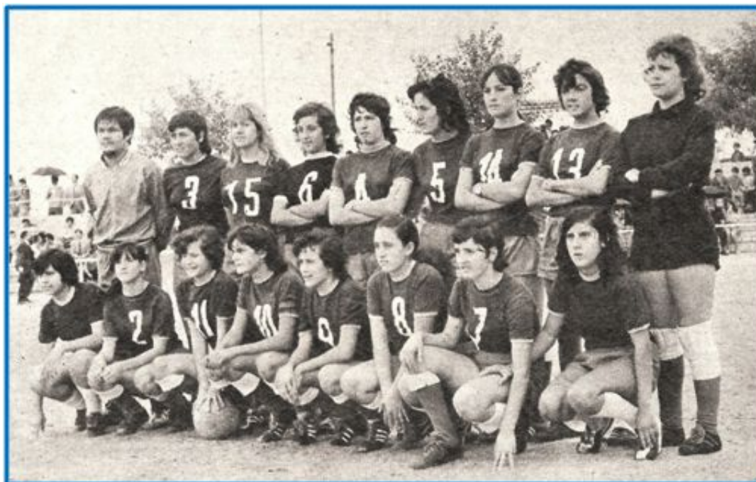
El Olímpico Villaverde, la temporada 1971-72

Pero a pesar de todo, las españolas seguían queriendo ser futbolistas.