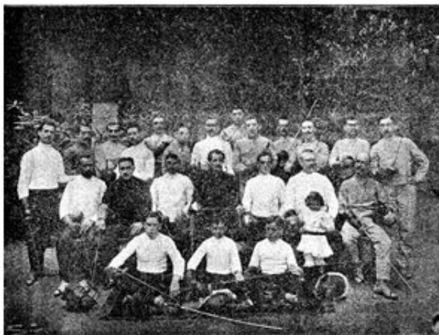
Los profesores y un grupo de alumnos del Gimnasio Solé

El Gimnasio Solé de Barcelona fue mucho más que un gimnasio, fue el lugar donde nacieron los más destacados clubs y entidades polideportivas, así como medios de comunicación y multitud de iniciativas en el ámbito del regeneracionismo en (o desde) la educación física, el deporte y el higienismo.