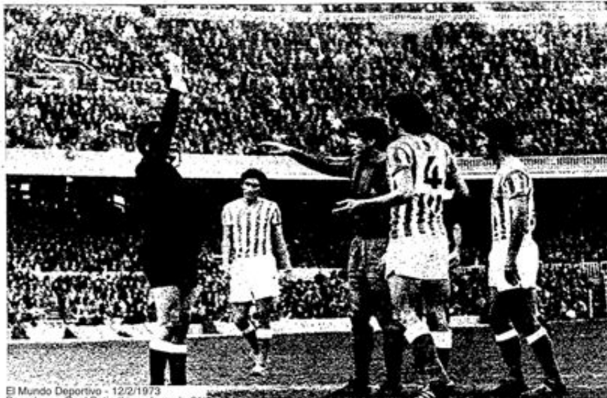
El Mundo Deportivo - 12/2/1973 Barcelona - Real Betis (Liga, Jornada 21)

Irregular: la actuación del colegiado, pues mientras en algunas ocasiones no vaciló en enseñar la tarjeta blanca, infracciones graves quedaron, inexplicablemente, sin sanción.