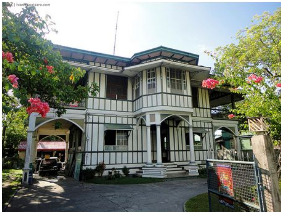
Casa de los Amechazurra en Silay (Isla de Negros, Filipinas)