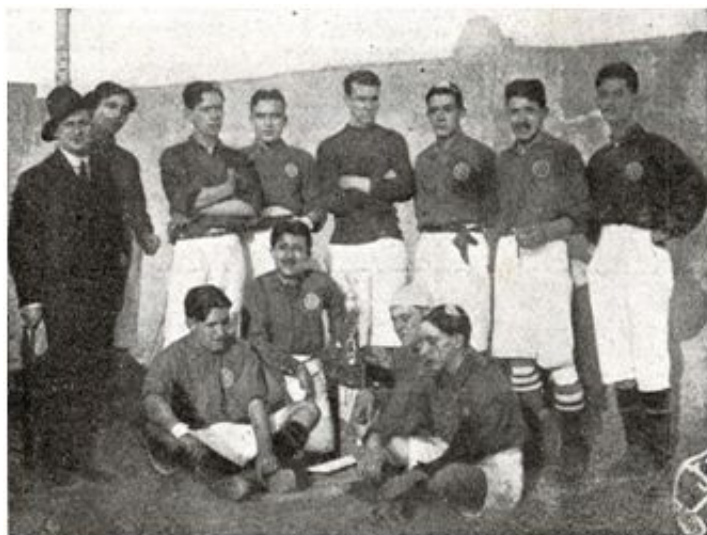
Equipo del Veloz Sport Balear durante las Fiestas Constantinianas (1913)

La piedra de toque que calibraba el nivel real del fútbol insular eran los partidos contra los equipos de escuadras navales extranjeras. En ellos el VSB , año tras año, salía escaldado sin remisión: