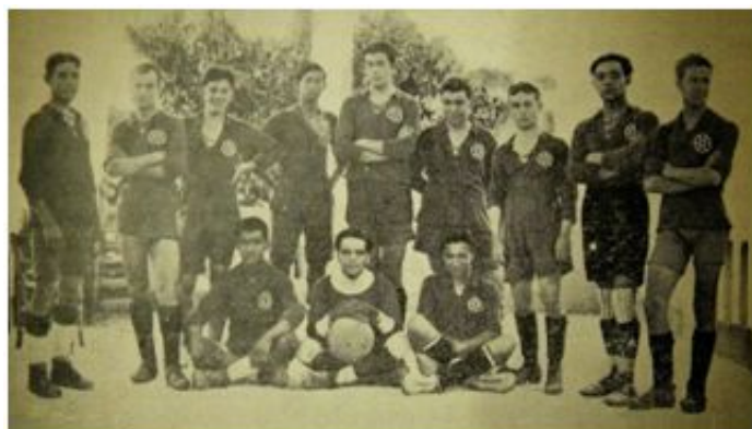
Equipo del Veloz Sport Balear (1920)