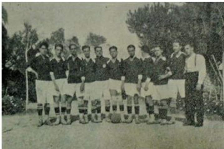
Equipo del Veloz Sport Balear (1925)

En esta etapa el VSB solo alcanza a jugar partidos amistosos contra equipos pequeños. Nunca llega a federarse (por tanto, jamás ha disputado un partido de liga) y en todo momento estuvo lejos del nivel de los grandes equipos, con quienes no disputa ningún enfrentamiento directo. El equipo fue espaciando gradualmente sus intervenciones durante 1925 y, aunque llegó a disputar un último partido contra un equipo de la escuadra inglesa (2-4), nunca se mostró fuerte.