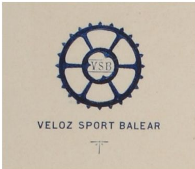
Escudo del Veloz Sport Balear (1915)

A finales del siglo XIX el deporte en las Islas Baleares era un exótico privilegio para clases acomodadas y se reducía a una práctica minoritaria, ociosa (poco o nada competitiva) y falto de un calendario de competición estable. Sin duda el deporte rey era el ciclismo (y lo siguió siendo durante varias décadas más); pero adolecía de unos altibajos en su práctica que desandaban los progresos logrados anteriormente. Las irregulares apetencias de sus practicantes, que se organizaban por moda o placer, eran el principal obstáculo para la implantación de una práctica deportiva regular. Si acaso la principal emoción estribaba en la rivalidad con el otro club velocipedico de la capital palmesana: el Círculo Ciclista , sociedad fundada unos meses después, en 1897. Los derbis entre los miembros de ambas entidades eran la principal emoción de una práctica deportiva incipiente basada en el ocio y la recreación.