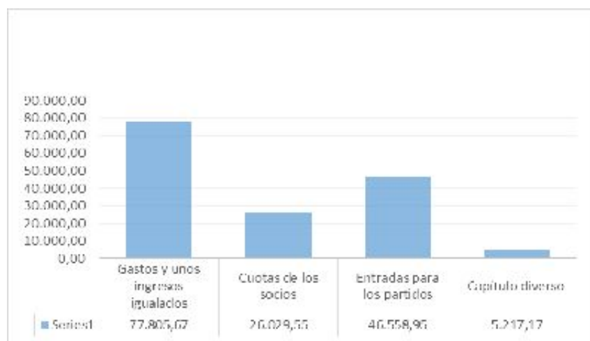
Gráfico 1. Finanzas del club en la temporada 1913-1914

Las finanzas del club entre el 1 de julio de 1913 y el 30 de junio de 1914 mostraron unos gastos y unos ingresos igualados de 77.805,67 pesetas. En el capítulo de entradas se pudieron ver la escasa diversificación que experimentaron las fuentes de financiación del club. Las cuotas de los socios fueron de 26.029,55 pesetas, es decir, 20 anuales para los socios, las entradas para los partidos aportaron 46.558,95 pesetas y un capítulo diverso que incluyeron la venta de insignias, aportaciones a la Federación y otros, 5.217,17 pesetas. El líquido de la caja fue de 1.464,45 pesetas. El año siguiente, a 29 de junio de 1915 la situación había empeorado, la caja se quedó en 31,82 pesetas mientras los ingresos superaron por poco a los gastos[36]. (Ver gráfico 1)