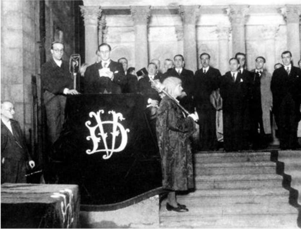
Jura de José Antonio Aguirre en Gernika (7 de octubre de 1936).