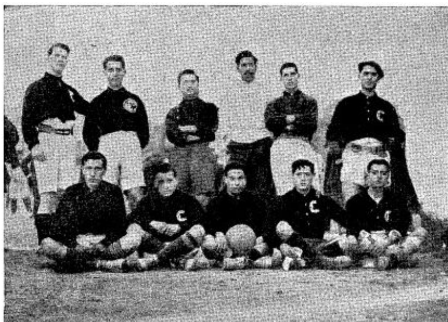
Equipo del Foot-ball Club "España" (Los Deportes, 15 de marzo de 1910, p. 70).

En septiembre de 1909 el España F.C. de Barcelona (club fundado en 1905, que en 1914 llegaría a ganar la Challenge Internacional del Sur de Francia, y que en 1923 cambiaría su nombre por el de Gracia FC, desapareciendo en 1931) anunció la disputa de un "Concurso España" destinado a clubes seniors de la Ciudad Condal, dotado con unos objetos de arte valorados en doscientas cincuenta, ciento cincuenta y cien pesetas. La respuesta inicial fue muy favorable a la iniciativa,