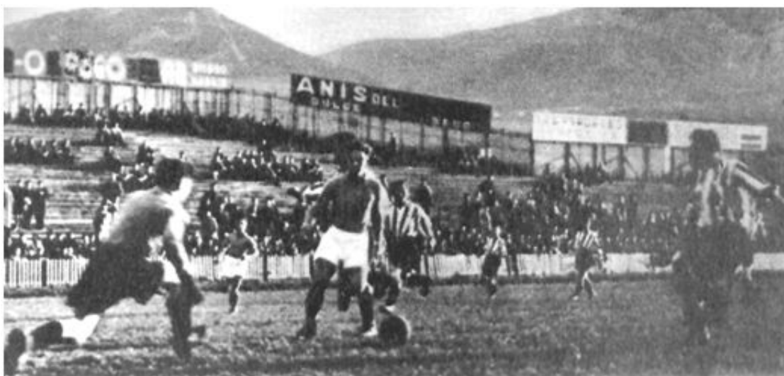
FOTO: San Mamés. 15 de enero de 1939. Bilbao Athletic Club, 3 – Erandio, 1. Echevarría sale decidido cortando el avance de un delantero del Erandio. Autor: Elorza. (Fuente: Marca de 25 de enero de 1939).