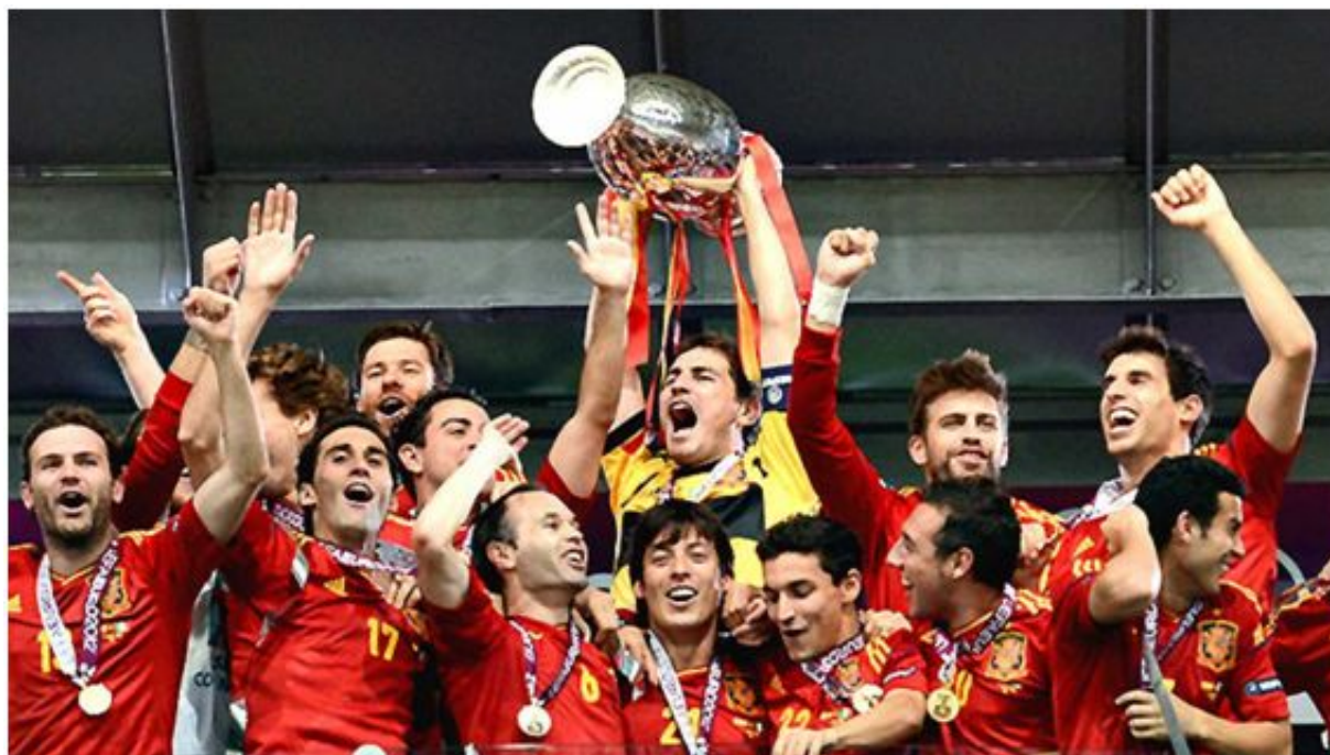
Eurocopa 2012.

Con Italia habíamos jugado el primer partido del torneo y habíamos empatado a uno, pero todos sabíamos que la final iba a ser otra historia. ¡Y vaya si lo fue!