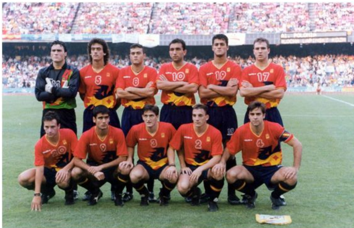
España en los Juegos Olímpicos de Barcelona 1992.

Ese sí que fue nuestro primer gran título en la presidencia, y uno de los objetivos más importantes con los que trabajé a llegar a la RFEF en 1988. Después del Mundial de 1982 era la primera vez que íbamos a jugar en casa en un gran torneo, y yo sabía que no debíamos desaprovechar la oportunidad.