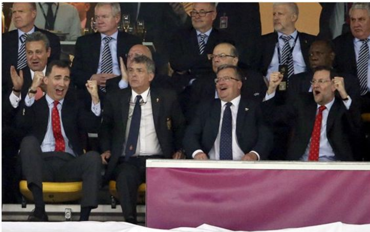
Eurocopa 2012.

Por supuesto también me traje como recuerdos varios balones, camisetas, ropa, documentación, y hierba del estadio de la final.