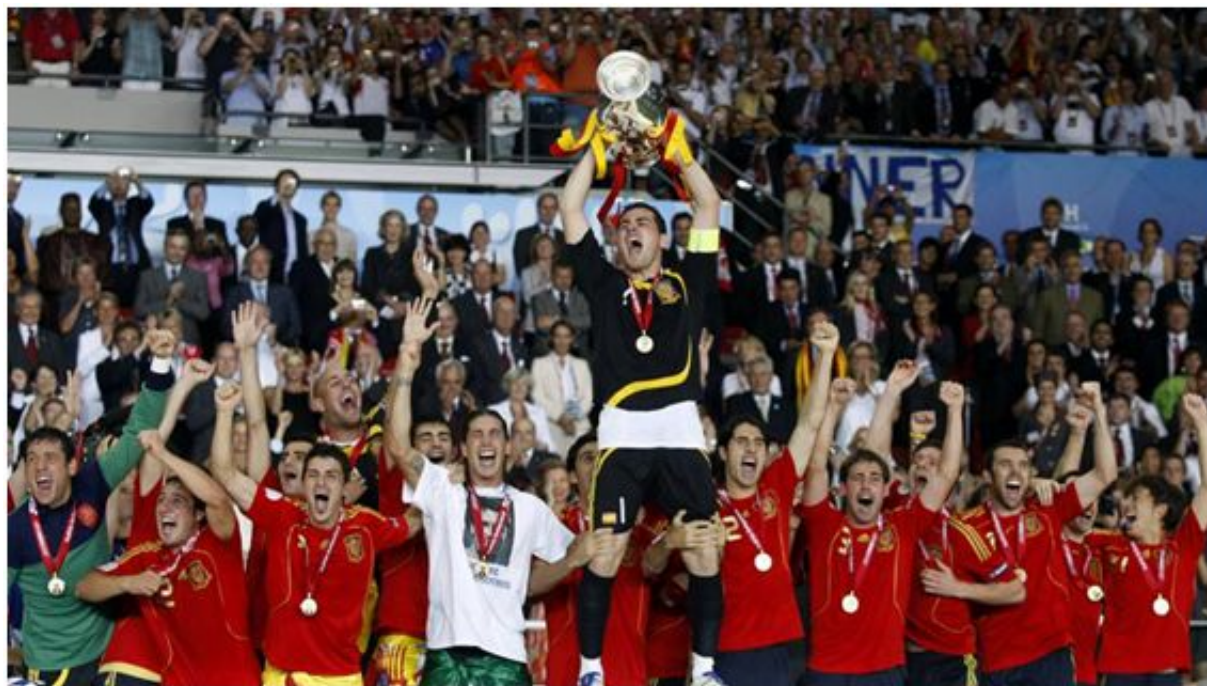
Eurocopa 2008.

No, no es cierto, no se puede hablar de cambio de etapa. Lo que vivimos en esa Eurocopa de 2008 celebrada en Austria y Suiza fue la culminación de una etapa, que es muy distinto.