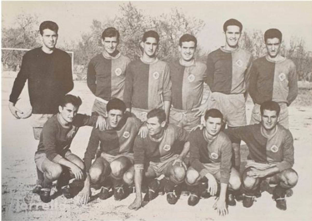
CD Soledad, temporada 1962-63 (Beco: El deporte en la barriada de La Soledad)