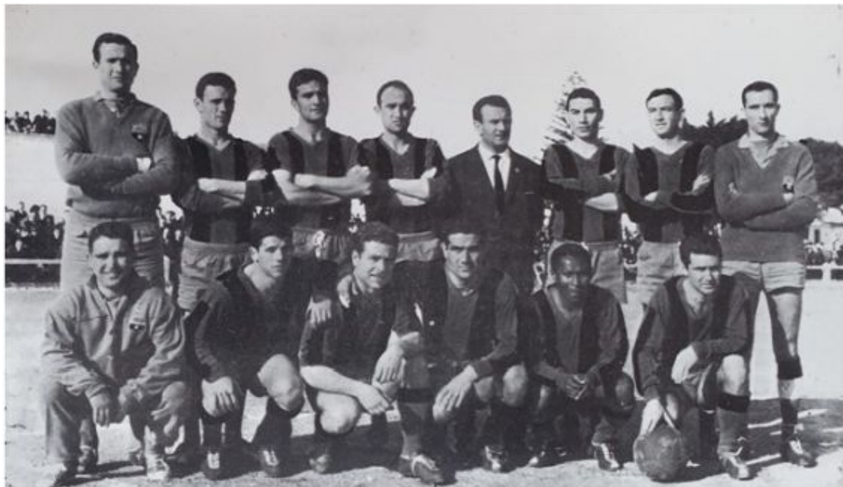
CD Menorca, temporada 1964-65 (Deseado Mercadal, El juego del fútbol en Menorca)