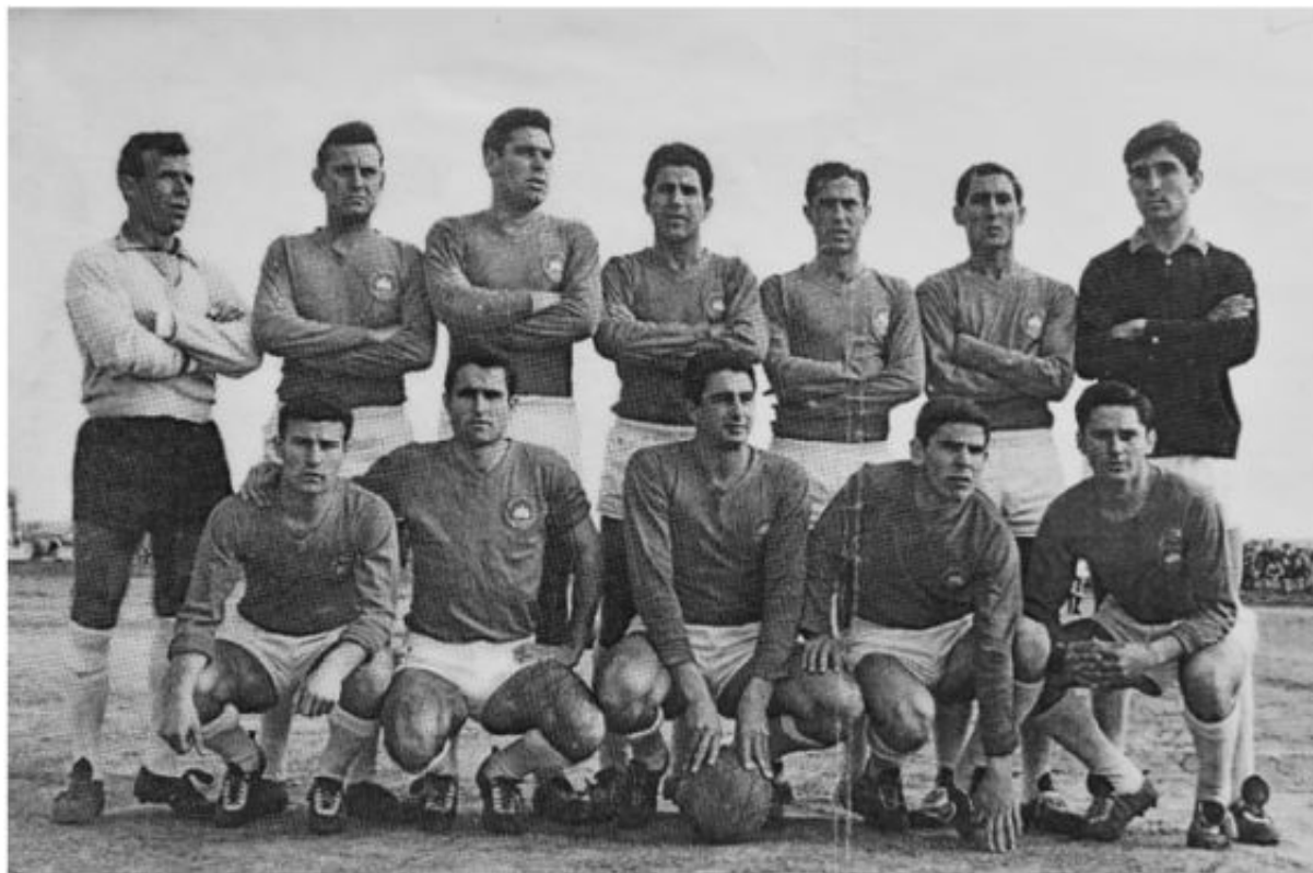
SD Ibiza, temporada 1962-63

Después de siete ediciones el desenlace del torneo parecía más lejano que nunca: ningún equipo conseguía enlazar más de una victoria seguida y lograr cinco ediciones alternas también quedaba muy lejos (el más laureado, el CD Felanitx, solo tenía dos y había dejado de participar).