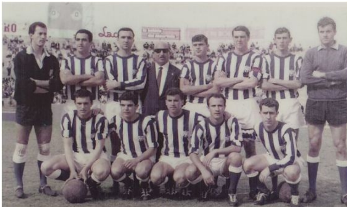
CD Atlético Baleares, 29 de abril de 1966 (Antoni Salas, L'Atlètic Baleares. La història en imatges)

De este modo el CD Atlético Baleares lograba su tercer título y segundo consecutivo, lo cual ponía al club blanquiazul en cabeza como equipo con más ediciones ganadas y ante la posibilidad de lograr la Copa Uruguay en propiedad si enlazaba un tercera victoria consecutiva.