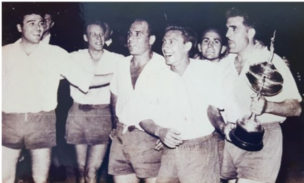
El CF Sóller con la Copa Uruguay, temporada 1959-60

Tercera, pero que competía con el reserva. Se impuso el CF Sóller, con lo que el torneo seguía sin reeditar campeón.