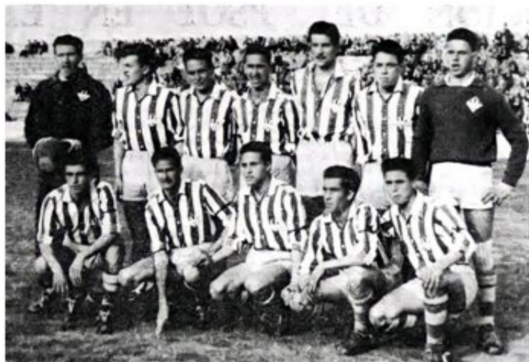
CD Manacor, temporada 1955-56 (Manacor, 25 de octubre de 1980)