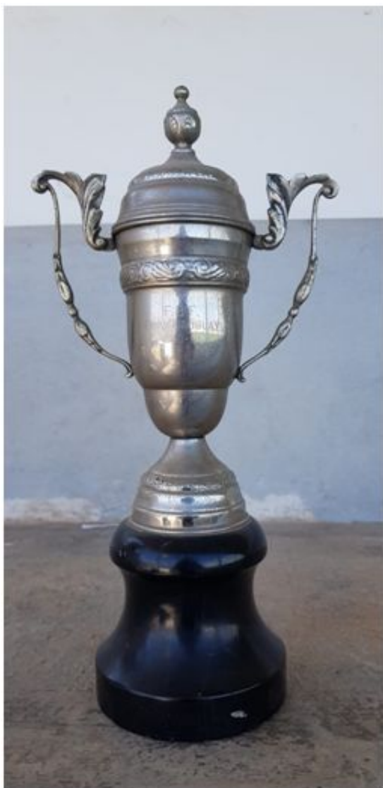
Copa Uruguay, temporada 1960-61

Dadas las circunstancias se mantuvo el formato de liguilla a doble vuelta, pero reducida a un solo grupo y sin eliminatorias posteriores. Por primera vez el torneo repitió campeón: el CD Felanitx, que consiguió su segundo título después de imponerse en la edición de 1957 y disputar la final de 1959, erigiéndose como el mejor equipo del torneo hasta el momento.