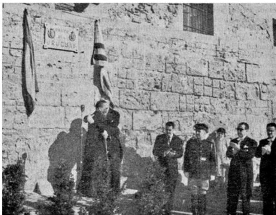
Acto de rotulación del Paseo del Uruguay. Palma, 20 de enero de 1955 (Memoria de Secretaría del ejercicio del año 1955. Ayto. de Palma, 1956)