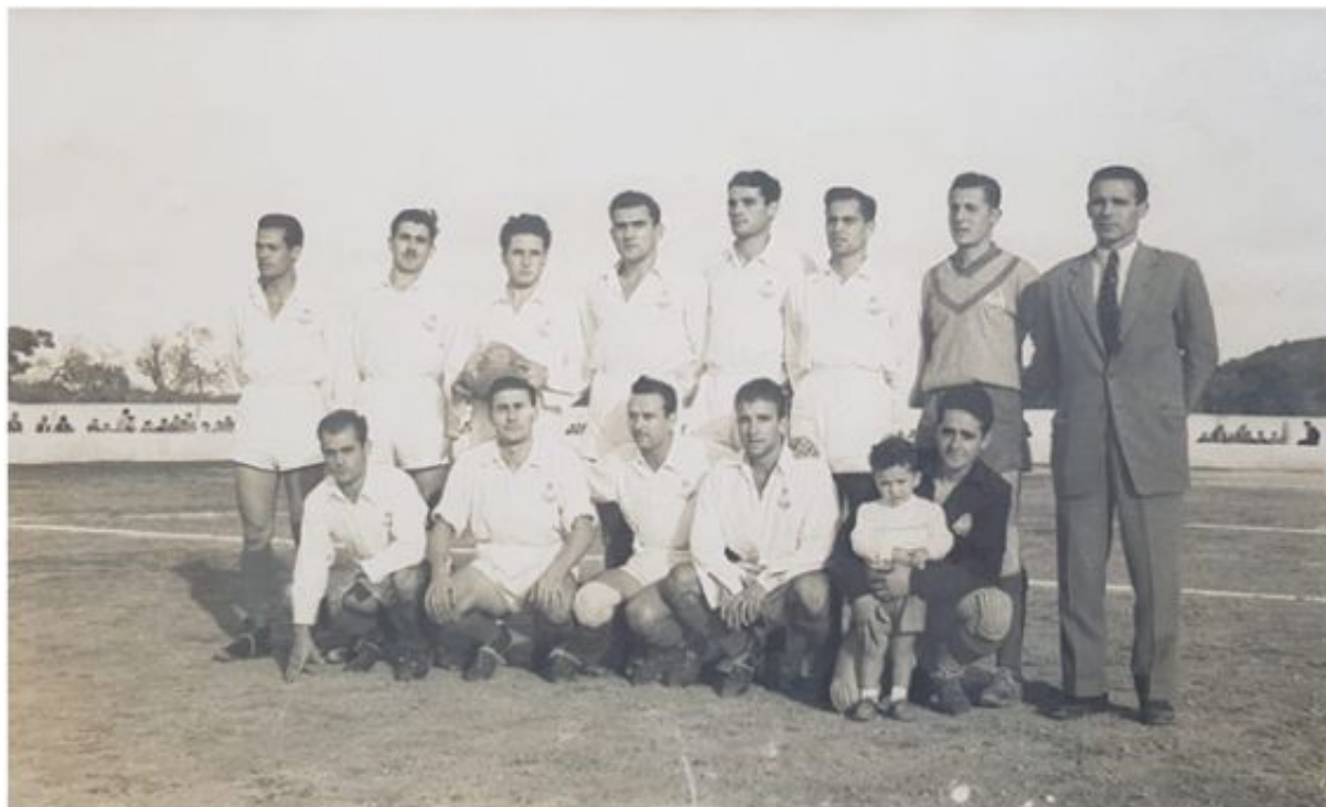
CD Felanitx, temporada 1954-55