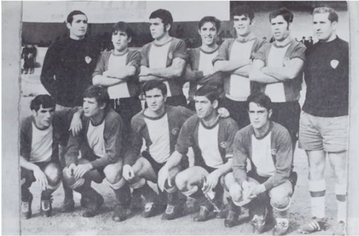
UD Mahón, años 60 (Deseado Mercadal, El juego del fútbol en Menorca)