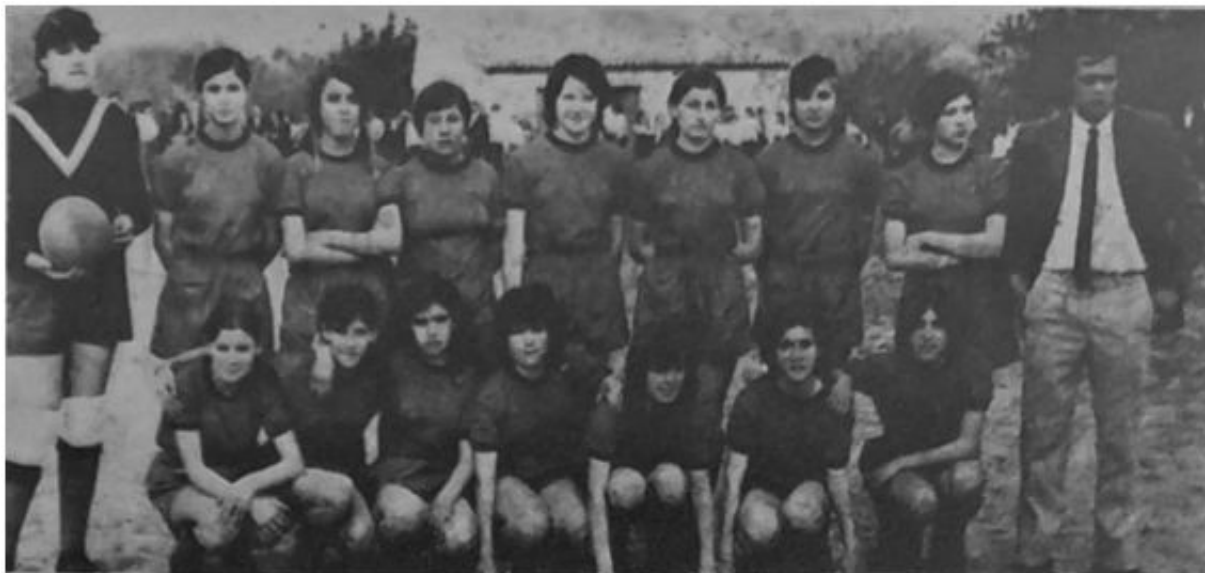
Imagen 5. CD Montaura (Diario de Mallorca, 16 de abril de 1971)

Otro lugar en el que también se consolidó un buen equipo fue el pueblo de Mancor de la Vall. El 11 de abril se jugó el partido de presentación del equipo local, integrado dentro de la infraestructura deportiva del CD Montaura local.