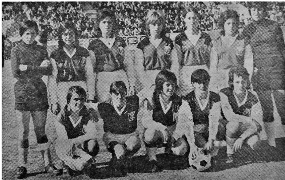
Imagen 3. CF Virgen de Lluç (Hoja del Lunes, 8 de febrero de 1971)

Como en el primer partido, el partido gozó de una cobertura mediática envidiable. El saque de honor lo hicieron figuras de relumbrón: los componentes del grupo musical Fórmula V. Y para sorpresa de propios y extraños, las mallorquinas mostraron un nivel de juego suficientemente maduro como para imponerse al Racing (2-1), remontando un 0-1 adverso y con goles de Monserrat a pase de Campos (ambas jugadoras habían destacado desde el inicio como las mejores de su equipo). Sin duda el CF Virgen de Lluç continuaba progresando; además preveía jugar más partidos en los pueblos de Mallorca, en donde las solicitaban para jugar con nacientes conjuntos locales. [6]