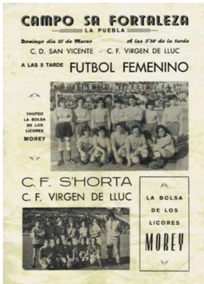
Imagen 6. Cartel partido CD S'Horta-CF Virgen de Lluc (Dies i Coses, mayo-junio 2021)

El primer encuentro se jugó el 23 de febrero en el Estadi Balear de Palma y el resultado fue rotundo a favor de las palmesanas (3-0); algo normal, pues eran el equipo más potente y rodado. La vuelta se jugó en Sa Pobla el 21 de marzo, y hubo sorpresa: el partido acabó en empate (1-1) y en los penaltis se impuso el CD S'Horta. Este fue un hecho muy comentado, pues el CF Virgen de Lluc se había mantenido hasta entonces imbatido.