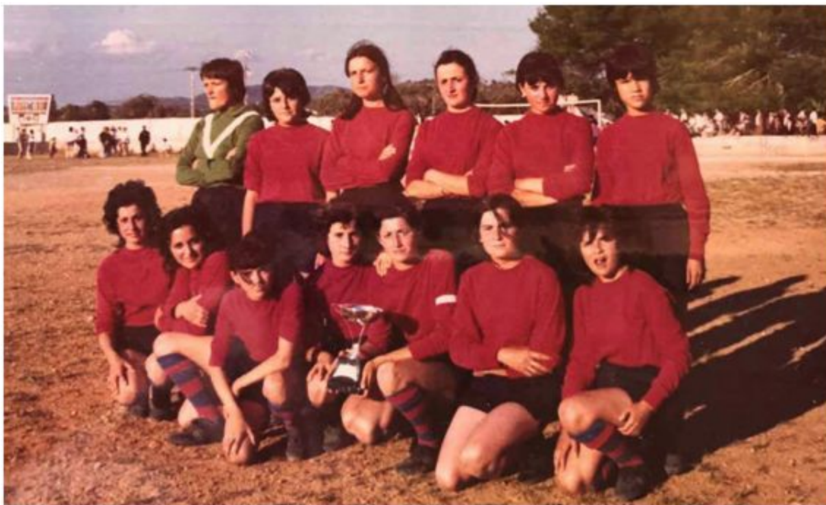
Imagen 7. CD S'Horta, febrero-marzo de 1971 (Dies i Coses, mayo-junio 2021)

El CD S'Horta fue un equipo tan potente como fugaz (dos meses de vida) y ha pasado a la historia como el primero que logró batir la hegemonía del primer dominador del fútbol insular, el CF Virgen de Lluc. De no haber desaparecido tan pronto seguramente hubiera participado en el campeonato oficial de la Federación Balear, con un papel más que destacable.