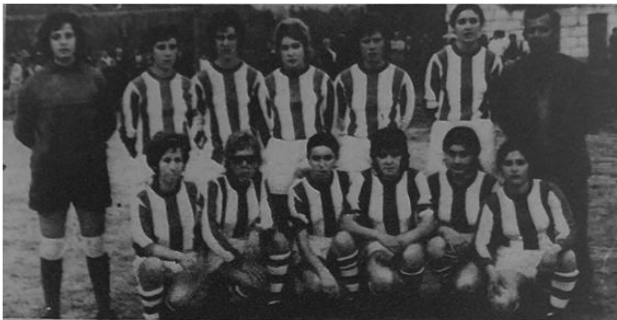
Imagen 4. CD Tagomago (Diario de Mallorca, 16 de abril de 1971)

En Son Ferriol, barrio de Palma, durante marzo hubo entrenamientos de un grupo de chicas, [12] pero no llegó a más. Y en Artà, el 2 de mayo hubo un partido entre dos equipos locales, infantiles y juveniles, [13] [14] que tampoco tuvo continuidad.