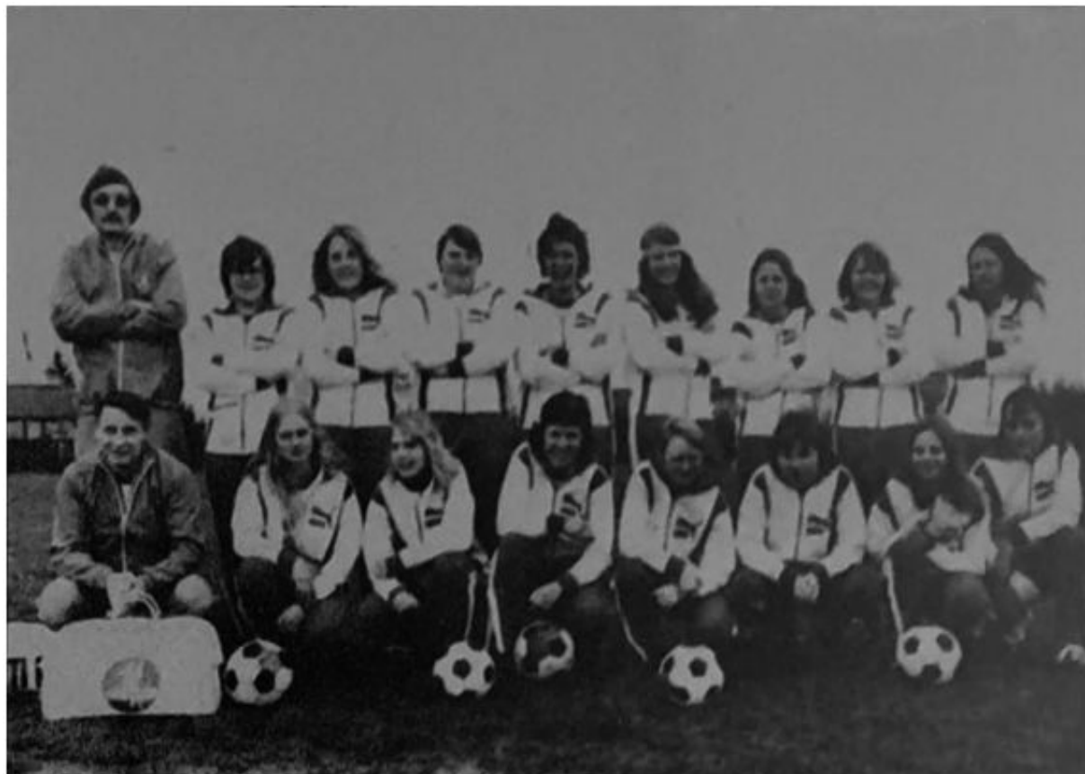
Imagen 12. Equipo del Gymnastik og Idrætsforeningen (Dinamarca) (Diario de Mallorca, 24 de junio de 1973)

El 1 de julio, en el Estadio Balear, se jugó el partido entre el CF Virgen de Lluc y las enfermeras, algunas de las cuales ya habían jugado en el RCD Espanyol y el FC Barcelona. Para días después se preveía el partido contra las danesas, [47] que no sabemos si llegó a jugarse