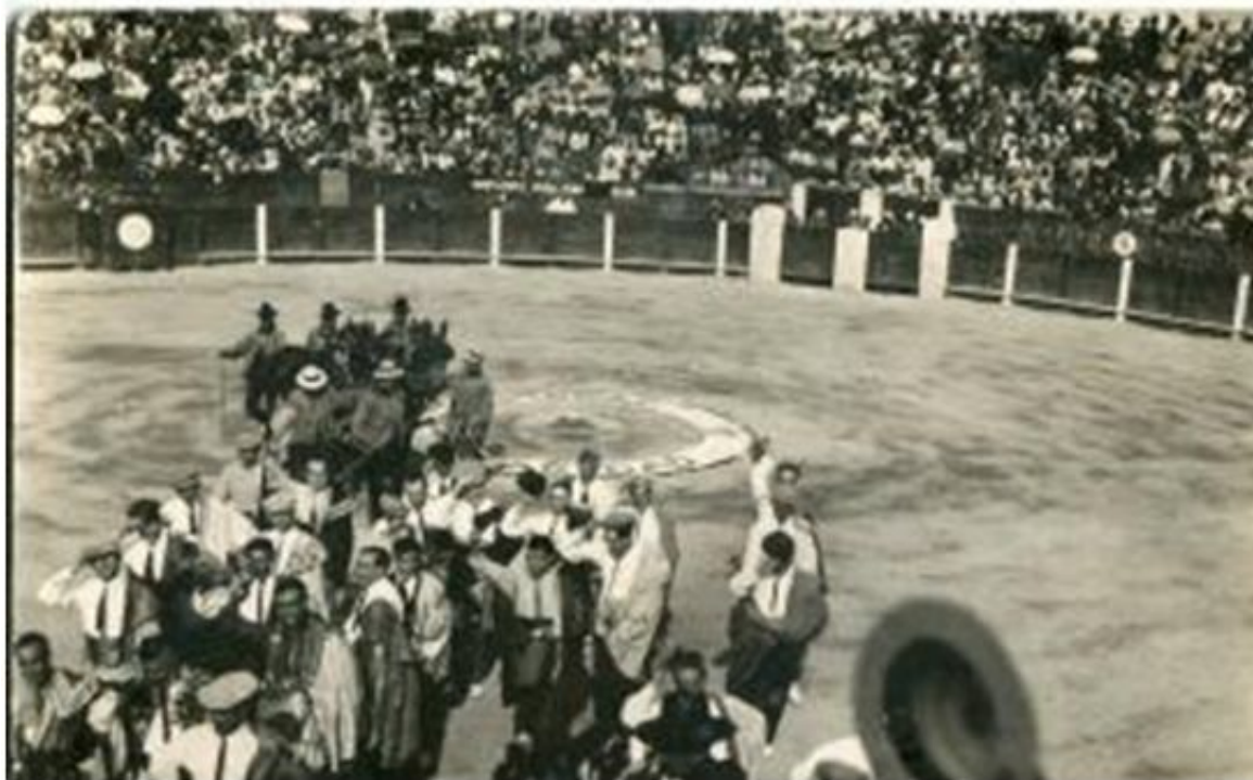
Figura 4. Becerrada en la Plaza de toros de Elche, 1923

Respecto a la corrida de Toros en beneficio del Hospital y el Asilo aparece una noticia a modo de diálogo en Levante , que habla de la caridad que promueve estos acontecimientos refiriéndose a los “infelices beneficiados” y a unas pesetas “mitigadoras”; se habla de que lo consignado es “mezquino e insuficiente” habiendo dinero en el Ayuntamiento que pueda mejorar lo aportado; termina el artículo tratando la posición de la madre Superiora como “enarbolando la bandera de la piedad” y opinando sobre los organizadores del evento cuya recompensa será “el elogio incondicional de la Prensa, su aliada”[10].