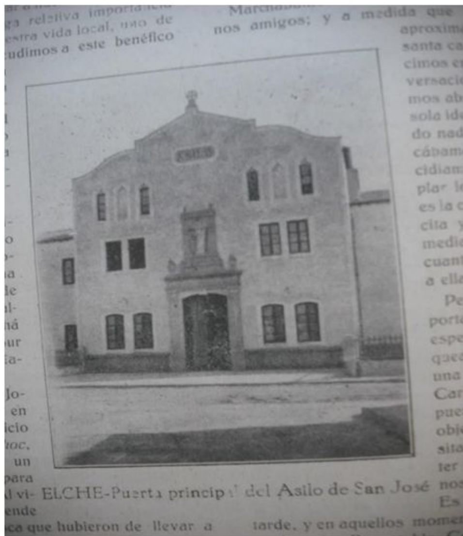
Figura 3. Puerta principal del Asilo de San José