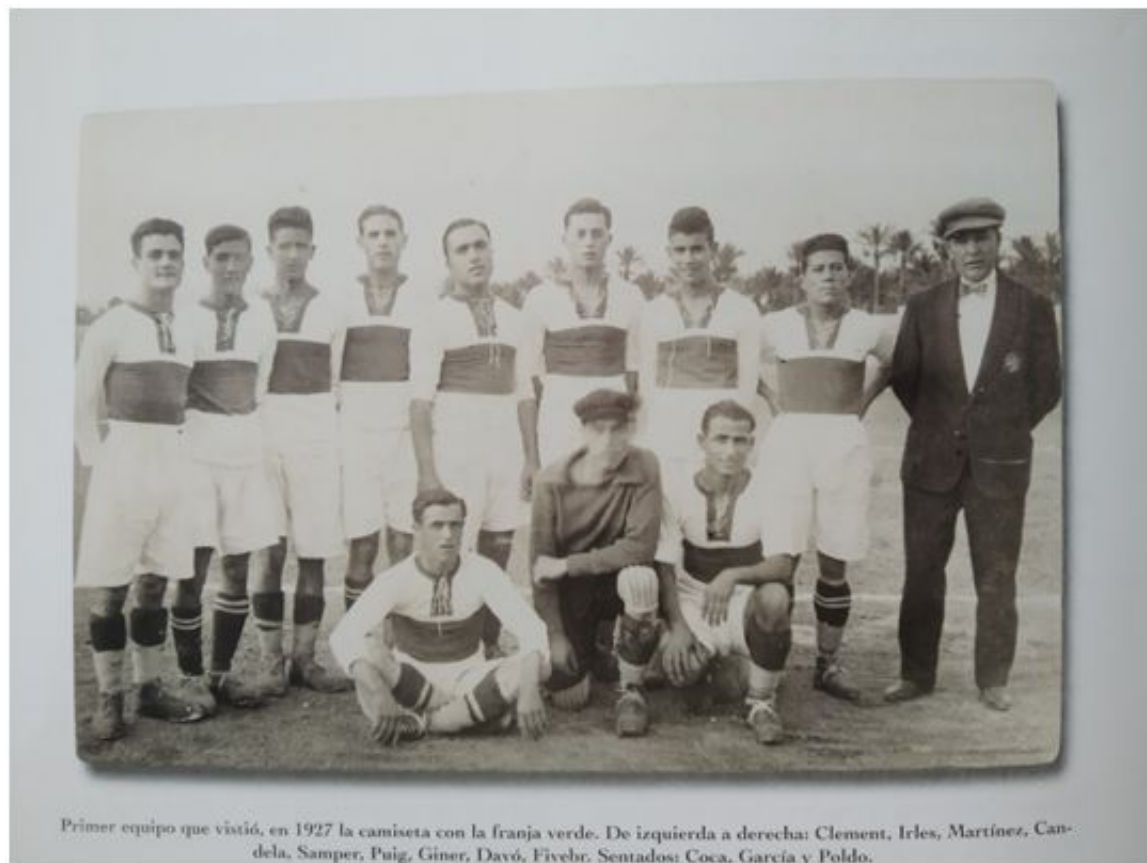
Figura 1. Elche C.F. 1927