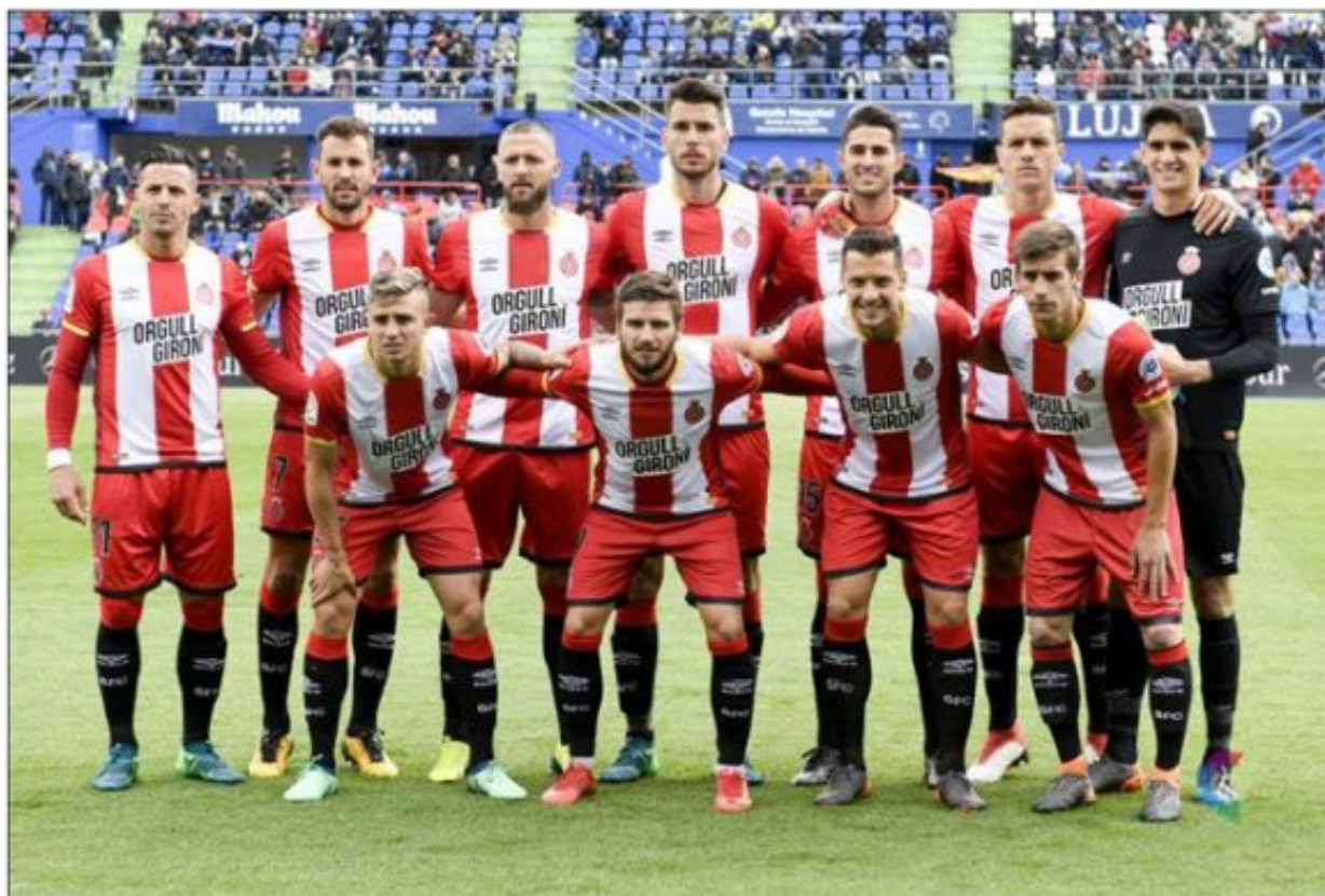
Formación 2017-18: Arriba: Aday, Stuani, Timor, Alcalá, Juanpe, Bernardo, Bono. Agachados: Maffeo, Portu, Granell, Pere Pons.

2017-18 (1ª-10): Bono; Maffeo, Bernardo, Ramalho, Mojica; Juanpe, Borja García, Portu; Pere Pons, Stuani, Granell.